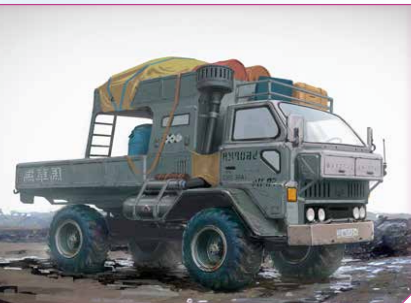
Megatech-IKCO Ruda Transport

Så nu vet du mer om Afghanistan. Behöver ni inresetillstånd så har jag en aibo ni kan snacka med. Varför undrar du?